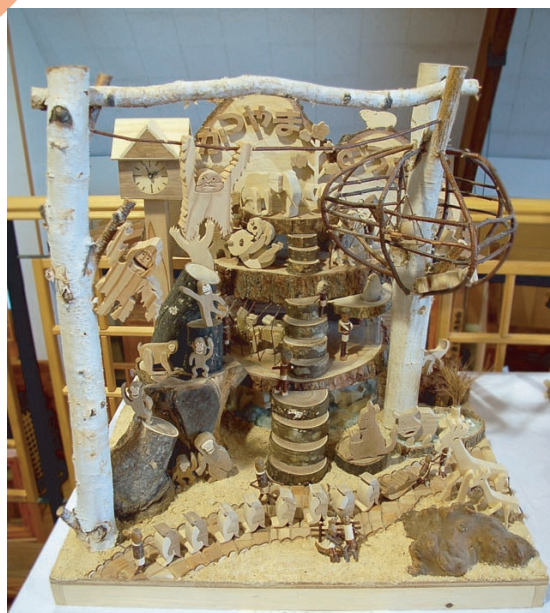
第16回「北海道こども木工作品コンクール」木工工作団体の部 最優秀賞（知事賞）の『かつやまどうぶつえん』 置戸町立勝山小学校4・5・6年生による力作です。