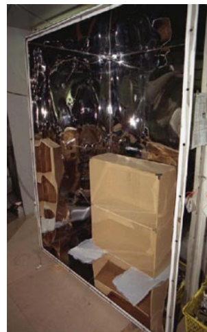
写真1 大形チャンバー

家具や教材からのホルムアルデヒドや揮発性有機化合物（VOC）の放散量は、日本工業規格（JIS）に定められた大形チャンバー法（JIS A 1912）で測定することができます。林産試験場では、大形チャンバー（写真 1）を作製し、家具の測定を行ってきました。放散の可能性がある家具や教材を測定することによって、対策を行うべき放散源を特定することが可能です。